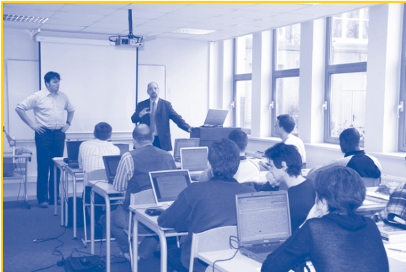
Cursus over leiderschap

Op 20 maart jl. vond de aftrap plaats van een nieuwe cursus aan de ETF: "Models for Christian Leadership". Deze Engelstalige cursus wordt gegeven aan studenten die zich in het vierde of vijfde jaar van hun studie theologie bevinden (masterfase).